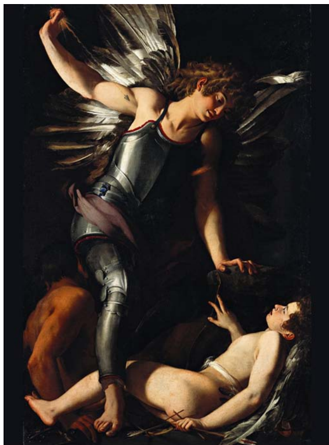
The Divine Eros Defeats The Earthly Eros, Giovanni Baglione

To je jeden z nejzávažnějších problémů, které nám přináší současné jazyky, neboť se staly velmi chudými v mnoha vnitřních aspektech, přestože jsou velmi bohaté v pojmenování všeho technického, všeho materiálního, všeho vědeckého. Jsou velmi chudé na to, aby se ponořily do hlubin lidské bytosti. Ve starověkých jazycích pro vyjádření různých druhů lásky existovalo tolik slov, kolik v člověku existovalo různých citů nebo schopností milovat.